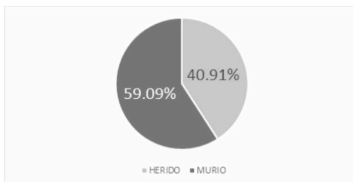
Figura 2: Mortalidad de los accidentes laborales en el rubro de la construcción