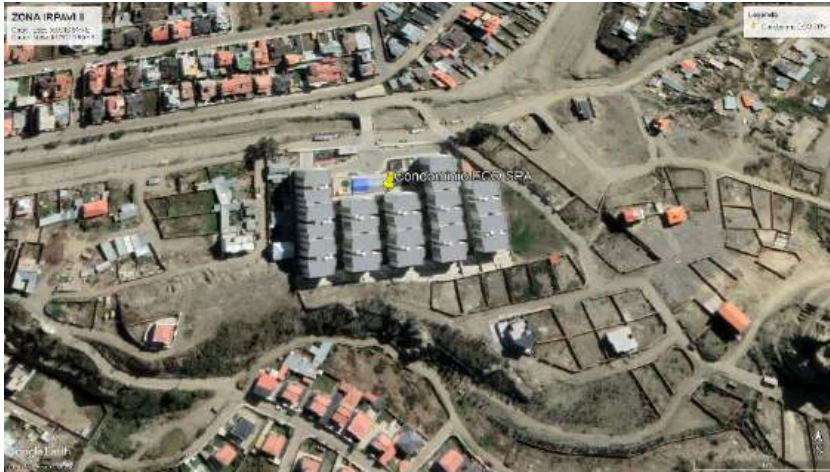
Conjunto habitacional Eco-Spa

Una vez revisada más información sobre el conjunto habitacional o condominio Eco-Spa, se halló una página de Facebook, a la que se accedió a través del siguiente enlace: https://www.facebook.com/EcoSpaCondominio/videos/3455480714485895/ . En esa página, se pudo encontrar algunas precisiones como que el conjunto habitacional estaba compuesto de doce edificios de ocho pisos casa uno, de dos a tres dormitorios por piso; pero además que el total de departamentos era de 192, que eran vendidos entre 120.000 a 130.000 dólares americanos cada uno. Asimismo, el área total construida superaba los 39.000 m 2 , lo cual equivale a una inversión de 102 millones de bolivianos (alrededor de 14 millones de dólares americanos), que permitió el empleo de alrededor de 800 personas (véase captura de imagen 1, en Anexos).