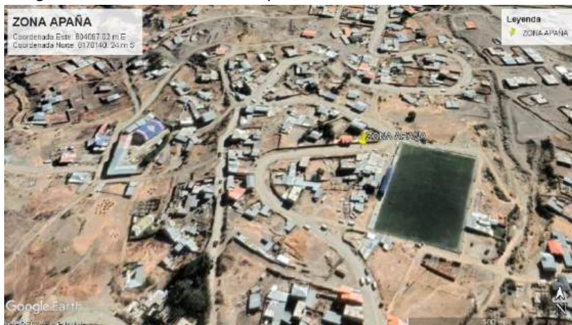
Imagen satelital de la Zona de Apaña