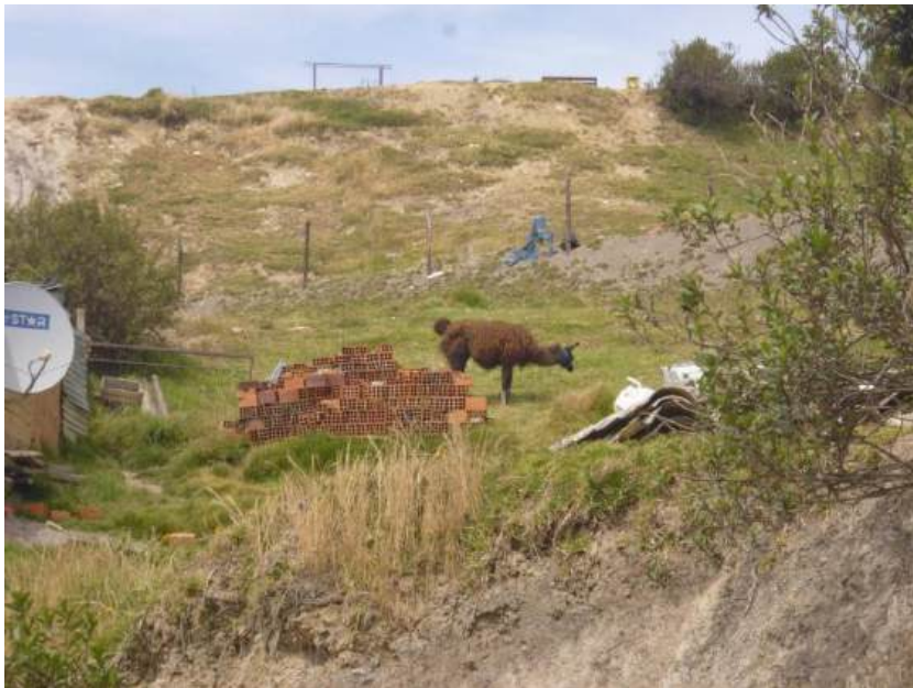
Comunidad de Apaña, zona Apaña

En la zona de Apaña, se puede apreciar que tampoco cuentan con conexiones domiciliarias de agua potable, pero en el camino se han puesto tanques de agua potable, puestos por la misma EPSAS S.A., aunque en esta zona se advierte la existencia de piletas públicas, pero con mayor distancia entre sí. En Apaña, se topó con personas que indicaron que eran comunarios y que habían vivido en el lugar desde siempre (véase Figura 5).