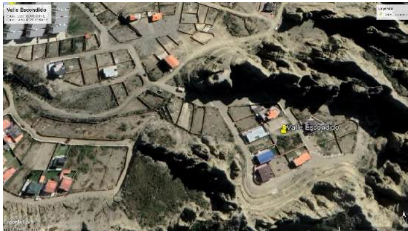
Figura 10 Urbanización Valle Escondido

Transitándose por la misma urbanización Valle Escondido, se encontró una casa en donde dos albañiles, un hombre y una mujer, trabajaban en la obra fina de la construcción de una vivienda con diseño arquitectónico moderno. En esta vivienda no contaban con agua, sino con un tanque de marca Campeón de 2.000 litros montado encima de un camión de fabricación china (véase Figura 11). Se comprendió entonces que se trataba de la frontera de la urbanización del agua y se pudo comprobar que la información que el agua que llega hasta esa zona fue financiada por el conjunto habitacional Eco-Spa. Dado que el alcance de la red de distribución solo llega hasta alrededor de una cuadra más arriba y nada más, se entiende cuál ha sido la dinámica por la cual se ha dotado a parte de la zona de infraestructura hidráulica y por qué no se ha hecho la referida dotación mucho más allá de esos alcances.