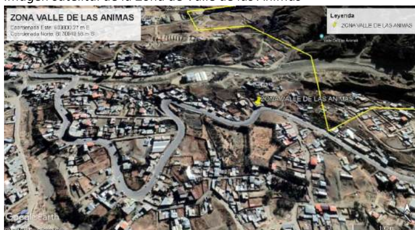
Imagen satelital de la Zona de Valle de las Ánimas

En cuanto a cuestiones operativas, cabe mencionar que EPSAS S.A. se reserva el acceso a las llaves de las piletas públicas para controlar su consumo. Para el consumo, el uso de las piletas públicas se organiza por hora. El tendido de la red de distribución no avanza, pese a que los vecinos de Valle de las Ánimas están dispuestos a autofinanciar el tendido de la infraestructura hidráulica que se requiere para acceder a conexiones domiciliarias. El tema es que, revisando la topografía de Apaña, ésta es sinuosa y con seguridad este aspecto influye mucho en la dificultad para viabilizar el tendido de las redes de distribución.