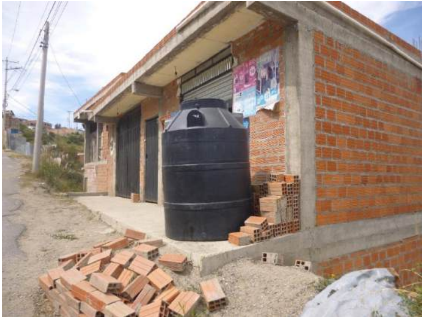
Tanque de agua, zona Valle de las Ánimas, Apaña

La familia del vecino informante del Valle de las Ánimas tiene tres maneras de acceder al agua. La primera es a través de las piletas que proporciona EPSAS S.A.; la siguiente es por un sistema de agua potable autogestionario en el que participan diez familias; mientras que la tercera manera es a través de un sistema de agua potable, también autogestionario, en el que participan solo dos familias. Para esta última, al tener que tomar agua del río y transportarla a sus viviendas, han tenido que pedir permiso a la comunidad de Apaña; pues pese a que la zona viene sufriendo un proceso de urbanización, el paralelismo organizativo de la organización comunal de Apaña mantiene el control y la gestión del territorio, de la tierra y del agua. Al parecer, hay cierto encono entre comunarios y nuevos vecinos. No está demás señalar que algunas otras familias —no precisamente la del vecino informante— acuden a una cuarta forma de acceder al agua; pero ésta solo es posible durante el periodo de lluvias: se trata de la cosecha de aguas que se recibe en los techos de calamina, que luego cae a pequeños bañadores depositados debajo de las salidas de agua. Cabe destacar que, además, los vecinos y los comunarios utilizan los ríos y/o vertientes de Apaña para el lavado de artículos del hogar.