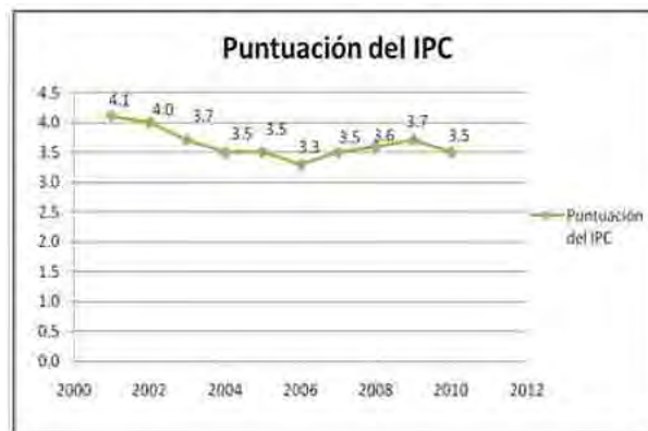
Gráfico N°02 Índice de Corrupción del Perú 2001-2010

Fuente: Transparencia Internacional. Elaboración: Propia.